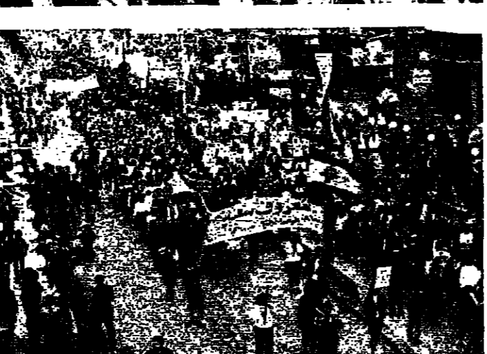
المسيرة في صيدا امس

صيدا - من نزيه تقوي: جندت صيدا ومنطقتها والجوار، العهد على تظاهرة مسيرة التحرير، ولماحقة الاسرائيل المحتل حتى تحرير كامل القرية، وذلك من خلال مشاركة اهلها وبنائها التي طرقت المجاورة في المسيرة الصالحة التي طرقت شوارع صيدا وضمت عشرات الافوف من المواطنين، وحشدت العهد على مواصلة الجيش المشترك وتحرير الارض.